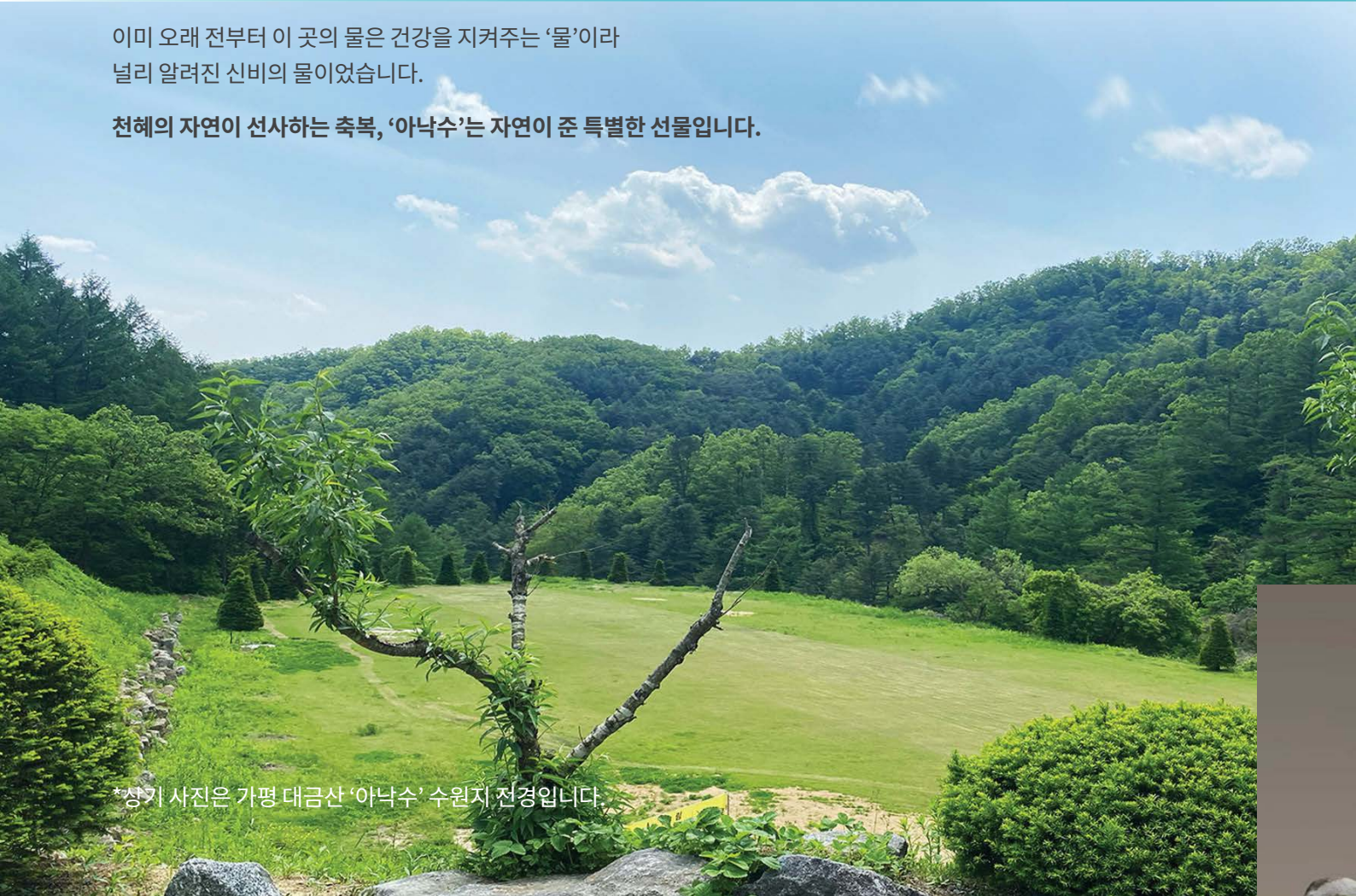
*상기 사진은 가평 대금산 '아낙수' 수원지 전경입니다.

천혜의 자연이 선사하는 축복, '아낙수'는 자연이 준 특별한 선물입니다.